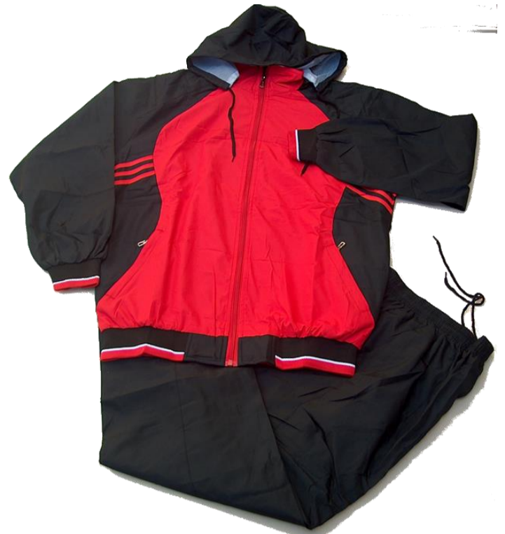
Negro / Rojo

Talla 4XL (Asiática) corresponde a talla XXL (Colombia)