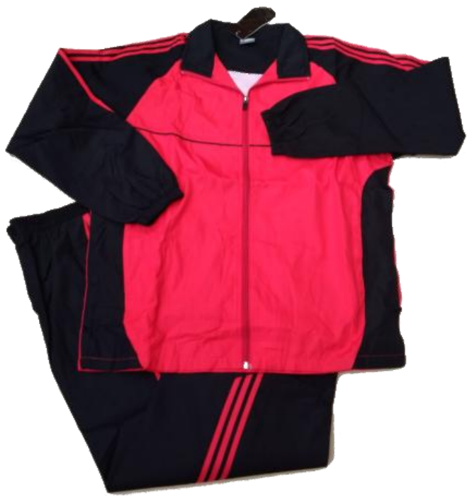
Negro / Rojo (Nautica)