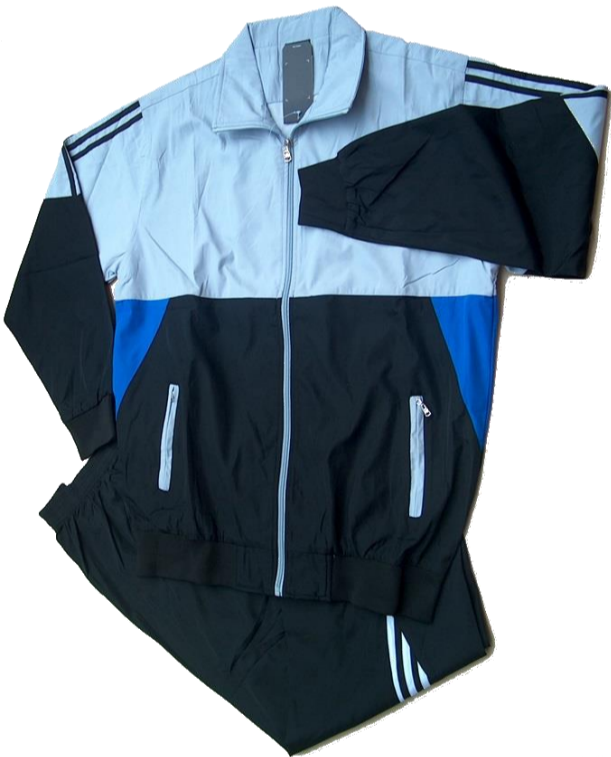
Negro / Gris Claro / Azul

Talla 4XL (Asiática) corresponde a talla XXL (Colombia)