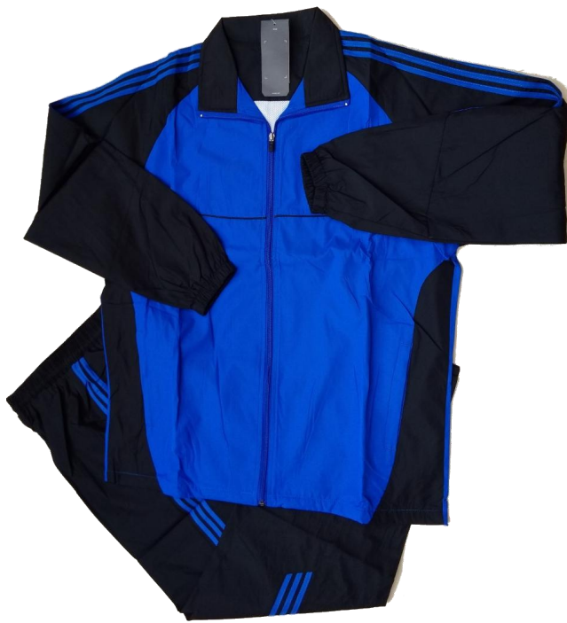
Negro / Azul (Nautica)