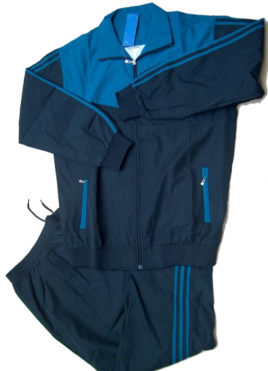
Azul Osuro / Azul Verdoso