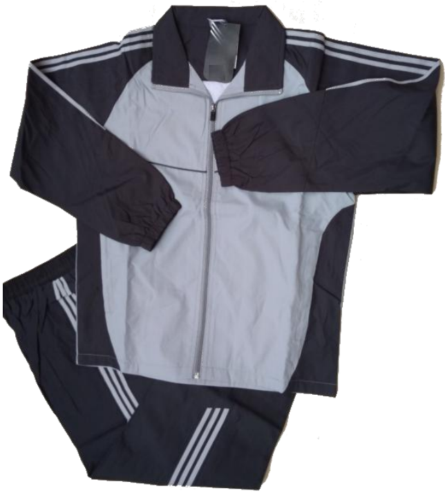
Gris Claro / Gris Oscuro / (Nautica)

Talla 4XL (Asiática) corresponde a talla XXL (Colombia) para pantalon 36-38