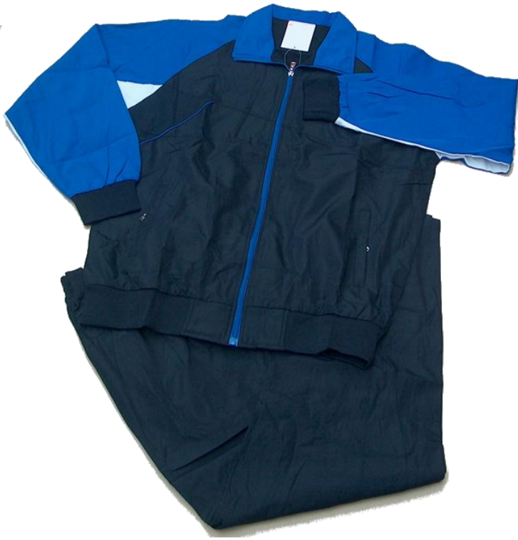
Azul Oscuro /Azul Rey / Blanco

Talla 3XL (Asiática) corresponde a talla XL (Colombia)