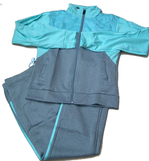
Gris / Verde Menta

Talla 3XL (Asiática) corresponde a talla 12-14 (Colombia)