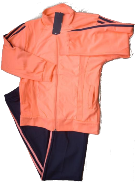
Salmon / Negro (Pantalón recto)

Talla 2XL (Asiática) corresponde a talla de pantalon 10-12 (Colombia)