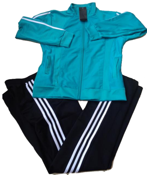
Azul Aguamarina / Negro/Blanco (Pantalón recto)