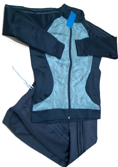
Gris Oscuro / Gris Claro

Talla 3XL (Asiática) corresponde a talla 12-14 (Colombia)