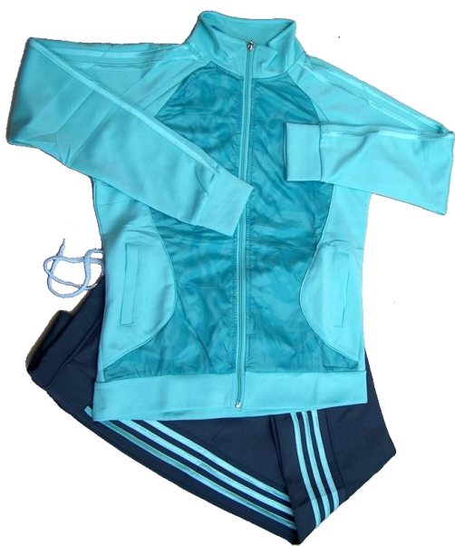
Verde Menta /Gris (Pantalón recto)

Talla L (Asiática) corresponde a talla de pantalón 6-8 (Colombia)