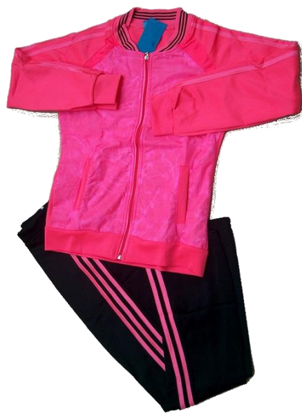
Fucsia/ Negro (Pantalón recto )

Talla 2XL (Asiática) corresponde a talla de pantalon 10-12 (Colombia)