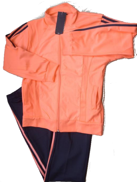
Salmon / Negro (Pantalón recto)