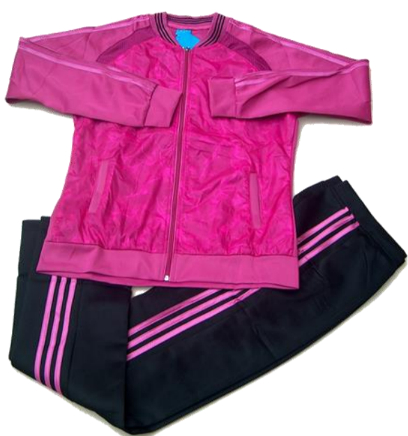
Morado / Negro

Talla 2XL (Asiática) corresponde a talla 10-12 (Colombia)