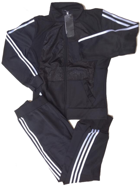
Negro/ Blanco (Pantalón Jogger)

Talla XL (Asiática) corresponde a talla de pantalon 8-10 (Colombia)