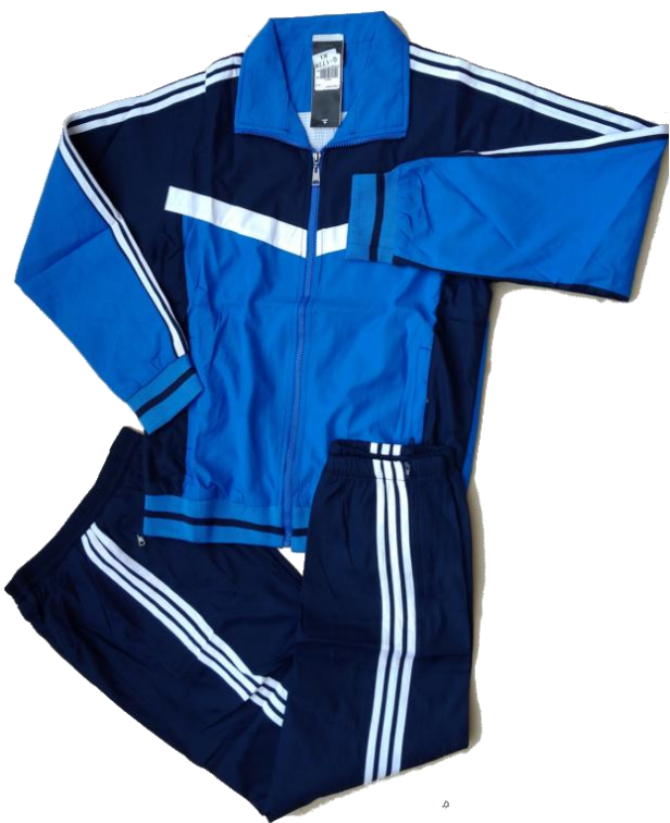
Azul Oscuro / Azul Rey / Blanco (Nautica)

Talla XL (Asiática) corresponde a talla S-M (Colombia)