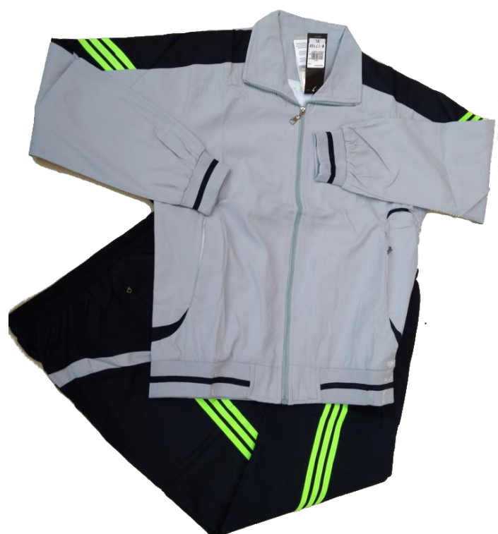
Azul Oscuro / Azul Rey / Blanco (Nautica)