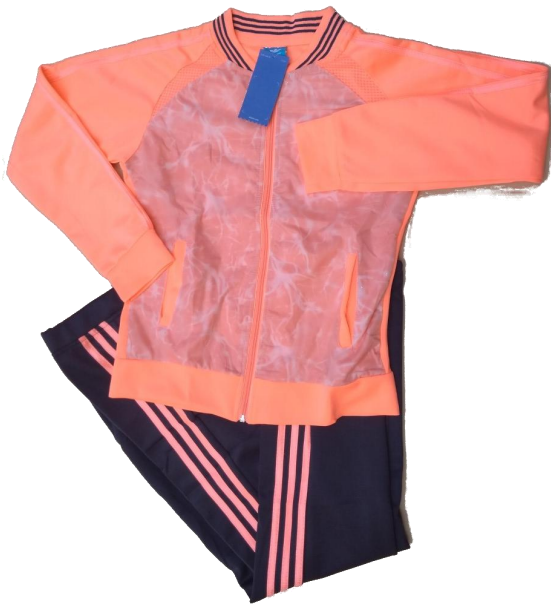
Salmon / Gris (Pantalón recto )