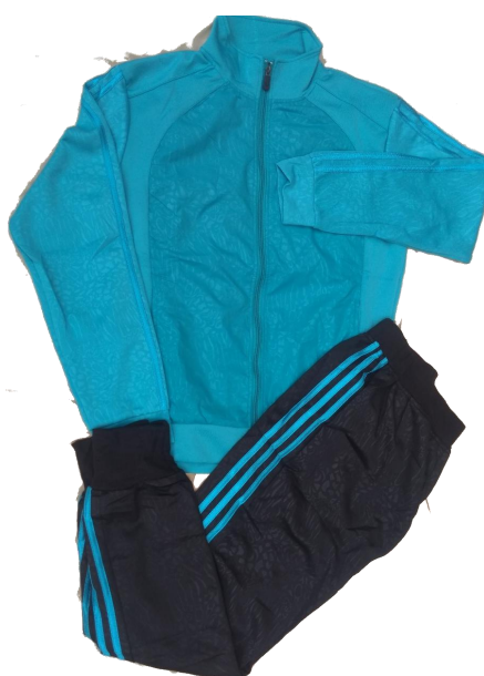
Azul / Negro (Pantalón Jogger )

Talla 3XL (Asiática) corresponde a talla de pantalon 12-14 (Colombia)