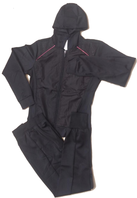
Negro / Fucsia (Pantalón Jogger )

Talla L (Asiática) corresponde a talla de pantalón 6-8 (Colombia)