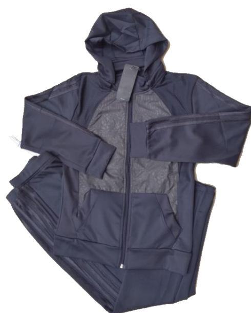
Gris Oscuro (Pantalón recto )