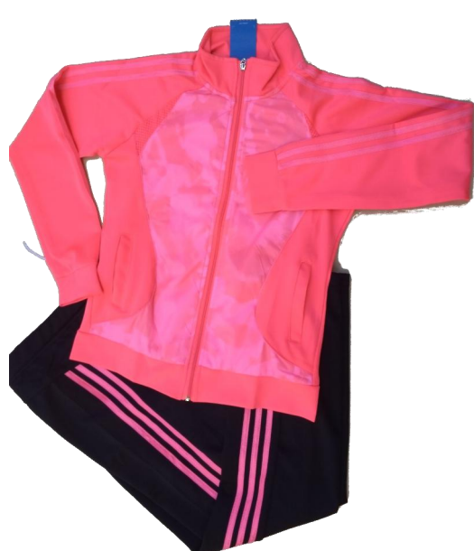
Fucsia / Negro (Pantalón recto )