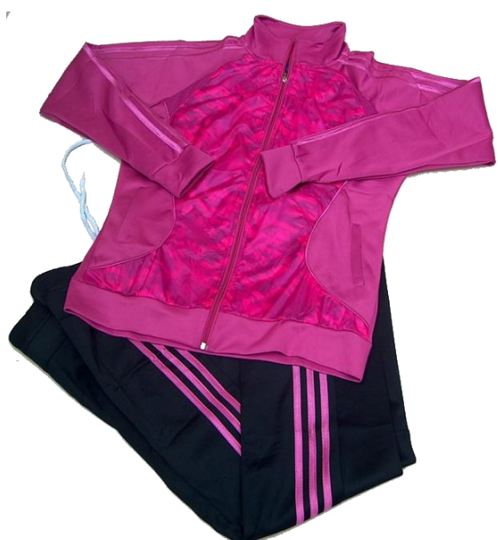
Morado / Negro (Pantalón recto )

Talla XL (Asiática) corresponde a talla de pantalón 8-10 (Colombia)