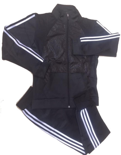
Negro / Blanco (Pantalón Jogger )

Talla XXL (Asiática) corresponde a talla de pantalon 10-12 (Colombia)