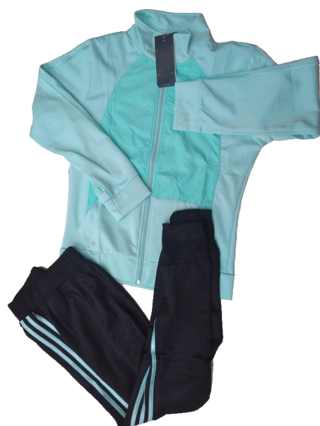
Verde Menta / Negro (Pantalón Jogger )