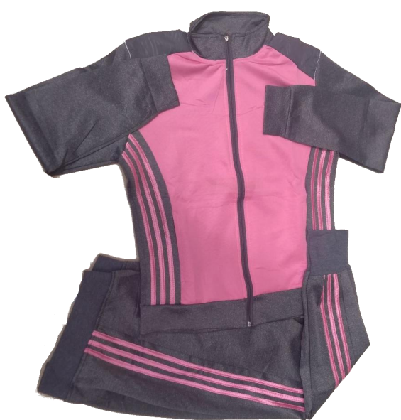
Gris / Rosado (Pantalón Jogger )

Talla 3XL (Asiática) corresponde a talla de pantalon 12-14 (Colombia)