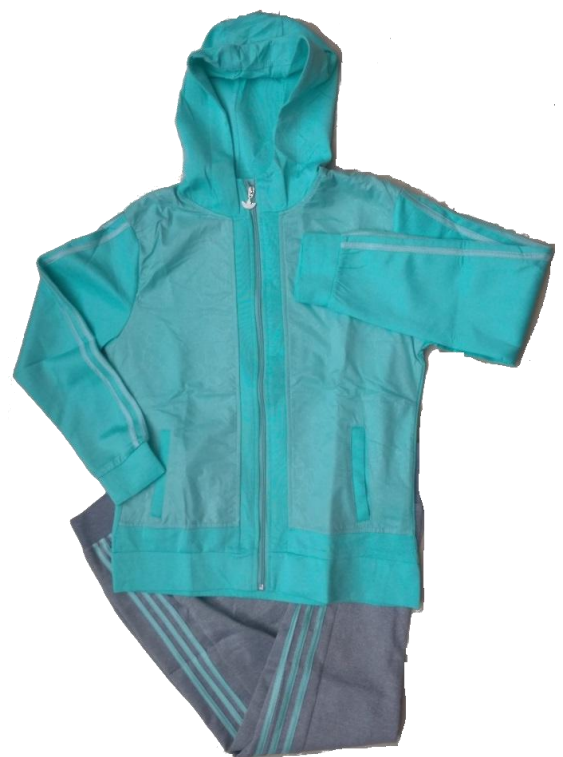
Verde Menta / Gris (Pantalón Jogger )